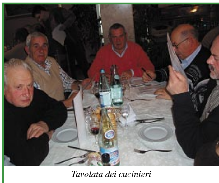
Tavolata dei cucinieri