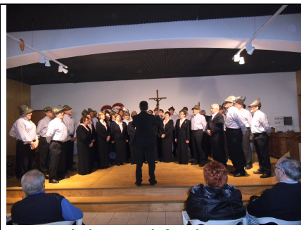
I due cori Assieme