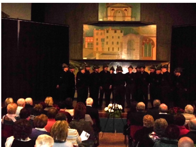
Il coro ANA AVIANO