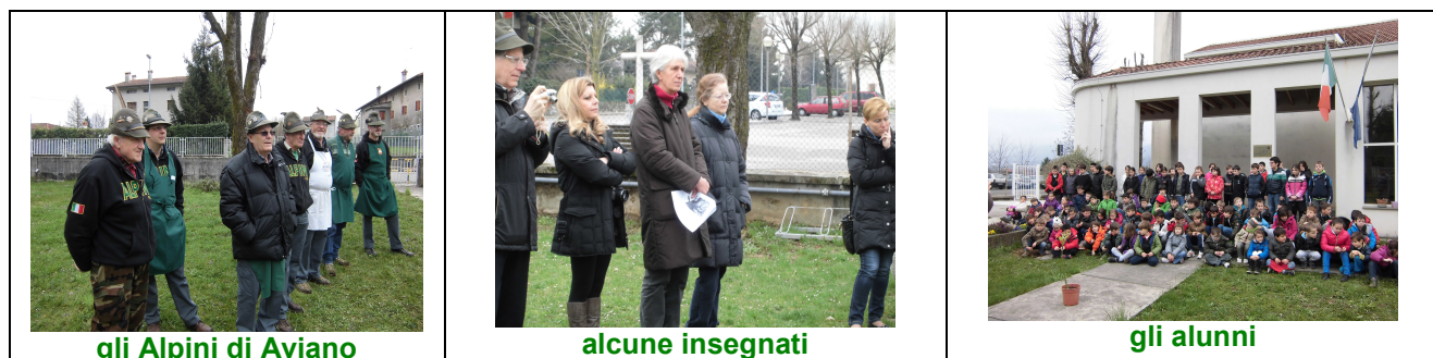
gli Alpini di Aviano

(Sotto alcune doverose foto della giornata ):