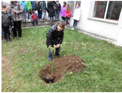
in azione con piantina