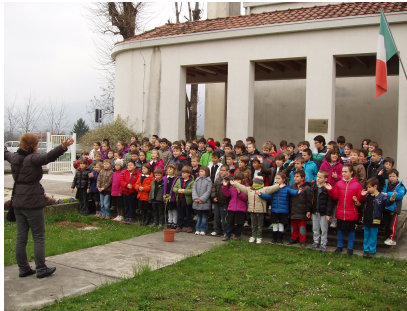
alunni che eseguono "sul cappello"