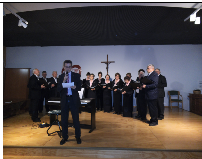
Corale la Betulla

Quest'anno si sono esibiti i due cori del Comune di Aviano "LA BETULLA" E IL "CORO ANA AVIANO" per onorare il Patrono di Aviano S.ZENONE. E' una rassegna che si inserisce nei festeggiamenti posti in atto dalla Parrocchia che vedono tante altre attività collaterali: concerto di Bobby Solo, l'estrazione della pesca di beneficenza, ecc.ecc. il tutto accompagnato da ottimi cibi, preparati dai volontari, diversi in ogni serata.