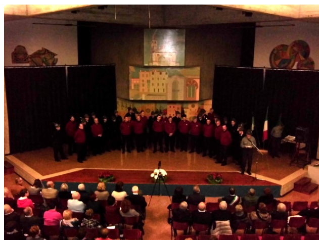
I Cori Riuniti