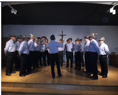
Coro ANA Aviano