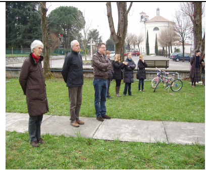
vice sindaco ,assessore e insegnati