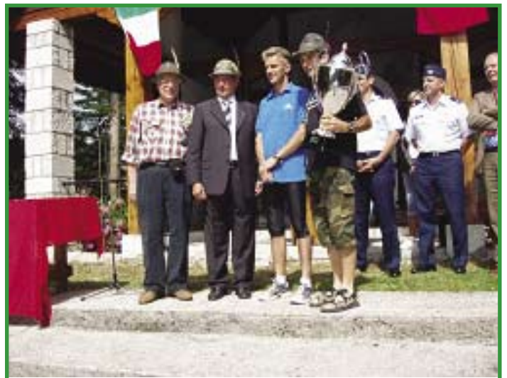
Consegna dell'XI Trofeo Madonna delle Nevi al Gr. Sportivo Alpini di Caneva