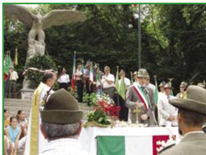
Intervento del Sindaco