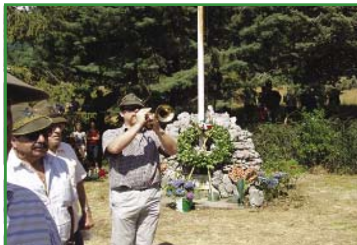
Squillo di tromba in onore ai caduti