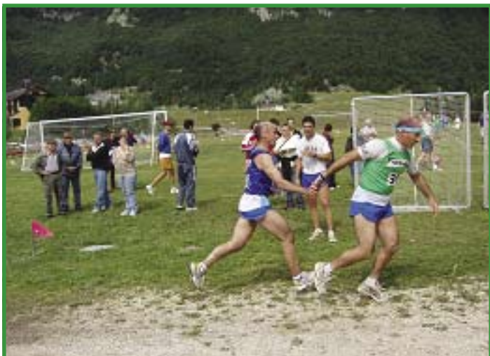
Un bellissimo passaggio del testimone nella gara a staffetta