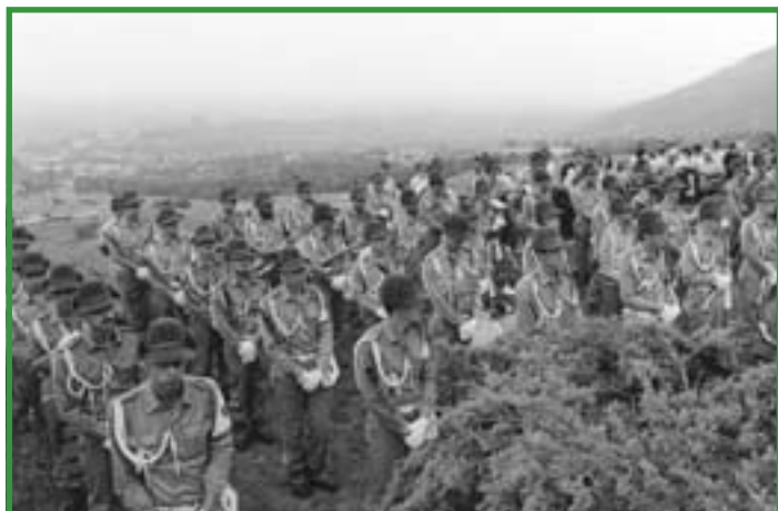
AVIANO - Fanfara della Julia d'altri tempi