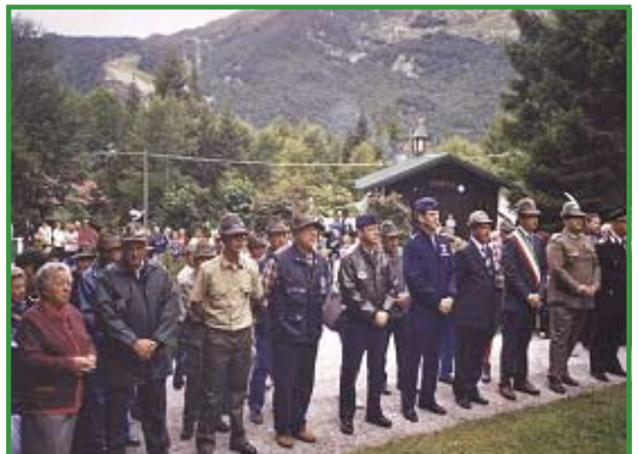
Autorità alla cerimonia