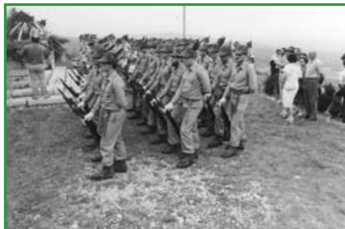
AVIANO - Picchetto della Julia.